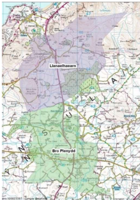
Map 1: Sefyllfa bresennol dalgylchoedd yr ardal